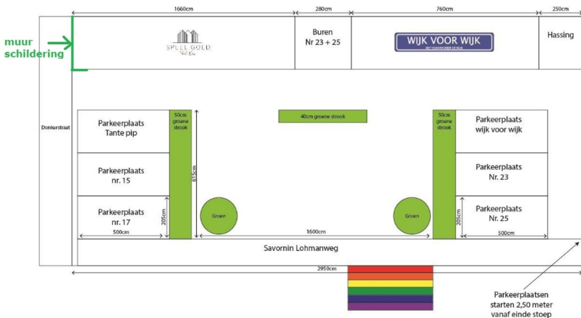
Gewenste plattegrond nieuwe situatie Sociaal Plein

Eind 2021 heeft de sociale onderneming Wijk voor Wijk in opdracht van gemeente Dordrecht onderzoek gedaan naar de wensen en mogelijkheden om de parkeerplaats aan de voorzijde om te toveren naar een groen en Sociaal Plein. In verbinding met bewoners en partners, zoals speeltheek Pip & Zo, Bibliotheek Aanzet locatie Crabbefhof en Buurtwerk Dordrecht. Een muurschildering op de kopgevel zal een belangrijk onderdeel zijn van de aankleding van het plein. De muurschildering zou zelfs de hoek om kunnen gaan en op straat kunnen doorlopen in een regenboogzebra. Het uitgebreide rapport met diverse input van bewoners, kinderen en organisaties uit de buurt is te lezen via site van Lotti Hesper. Naar verwachting start de uitvoering van het plein nog voor zomer 2022.