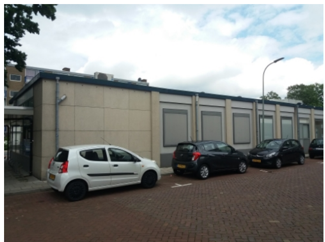
De drie dichte ramen van apotheek zijn elk 143 x 155 cm (breedte x hoogte).