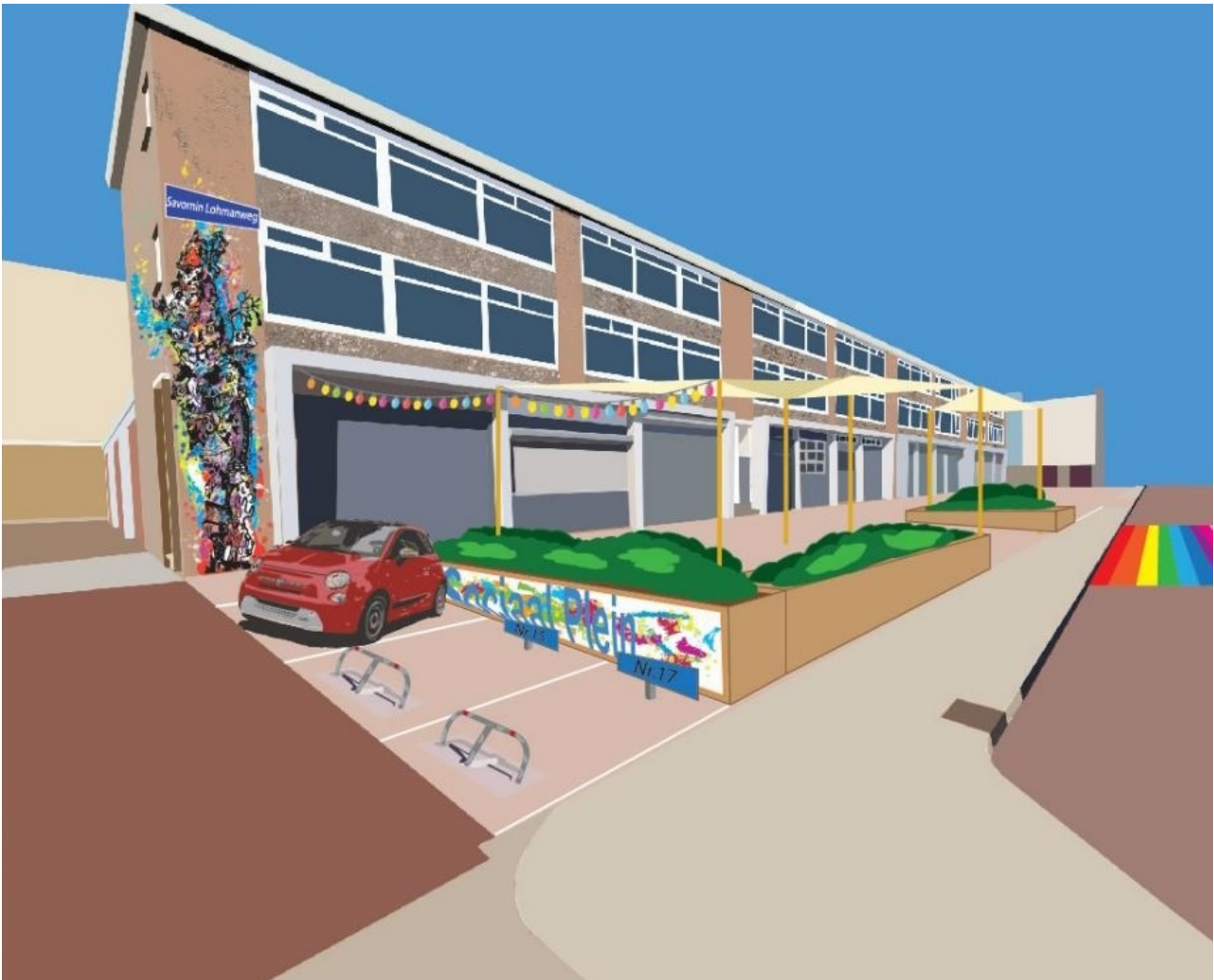
artist impression Sociaal Plein