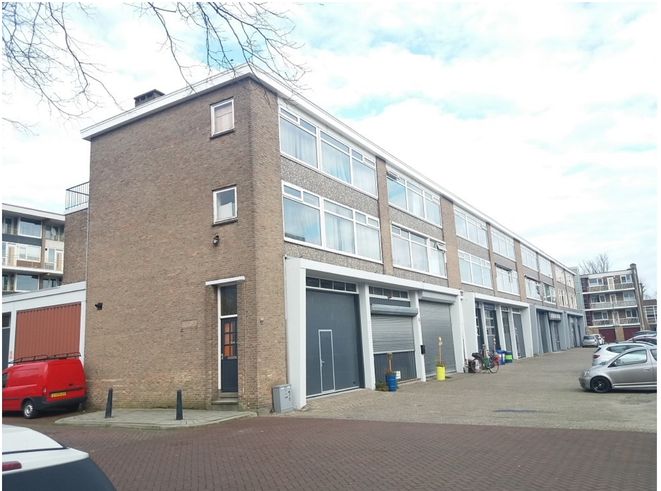
Artist impression & plattegrond: Wijk voor Wijk