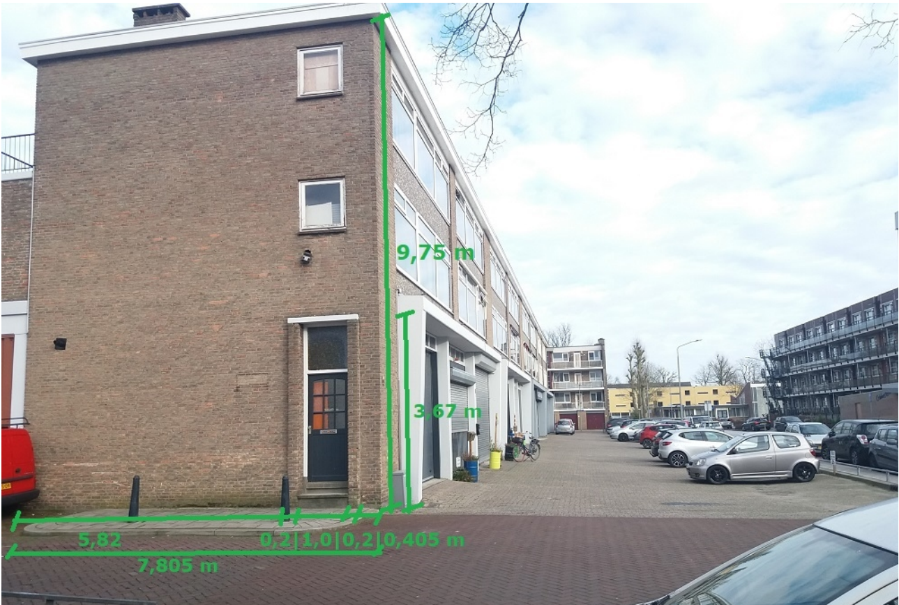
Aan de maten kunnen geen rechten ontleend worden.