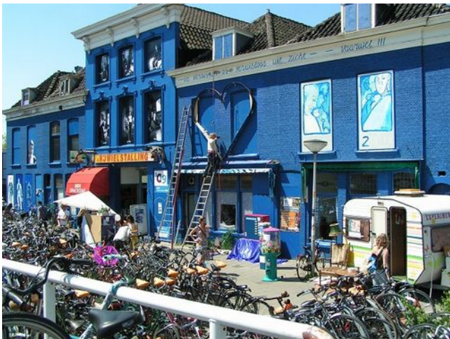
Delfts Blauwe Panden (o.l.v. Lotti Hesper)