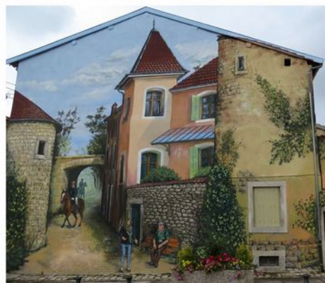
historische foto's Regionaal Archief | muurschilderingen Frankrijk en illustratie Tessa Jongerius (linksonder)