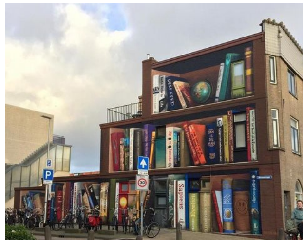
JanIsDeMan | Utrecht