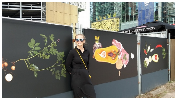
Aan deze briefing kunnen geen rechten ontleend worden.